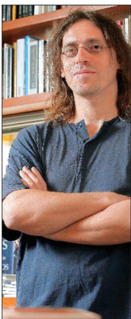
Belcastro ha sido crítico de los modelos individualistas de la música europea.

En Lens, ciudad de la región de Pas-De-Calais, abrirá el 4 de diciembre un nuevo recinto del Museo del Louvre. El centro ha tenido un costo de 150 millones de euros y no poseerá una colección propia. En cambio, acogerá distintas exposiciones temporales, algunas de las cuales se extenderán por cinco años. Entre las primeras piezas que se exhibirán están “Retrato de Mariana Waldstein” de Goya, y “Antonio de Covarrubias y Leiva”, de El Greco. El recinto tendrá una superficie de 28.000 metros cuadrados y contará con 205 piezas entre cuadros, esculturas y objetos decorativos. Pronto recibirá, en préstamo, creaciones tan insignes como “Santa Ana” de Leonardo Da Vinci y “La Libertad guiando al Pueblo” de Eugène Delacroix. El presidente del Louvre, Henri Loyrette, declaró a Le Figaro: “Queremos presentar una síntesis armoniosa del Louvre como museo universal”.